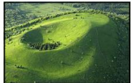
le Massif Central