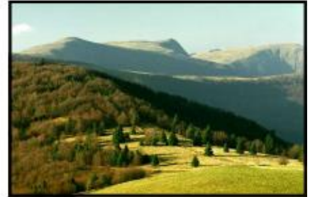
un sommet des Vosges