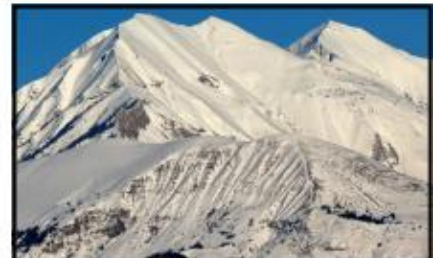
un pic enneigé des Alpes