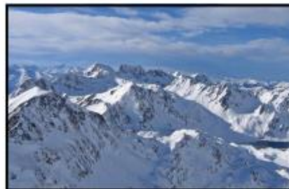
la chaîne des Pyrénées