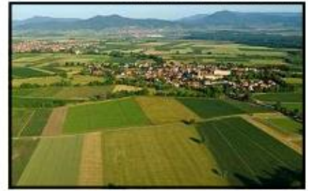
la plaine d'Alsace