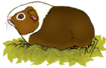
a guinea pig